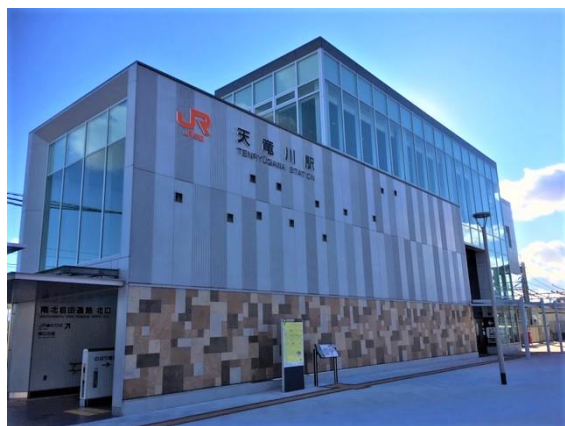
JR東海道本線天竜川駅 400m(徒歩5分)