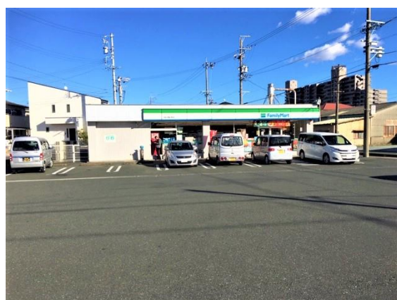
ファミリーマート 100m(徒歩2分)