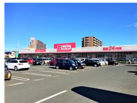
マックスバリュ 400m(徒歩5分)